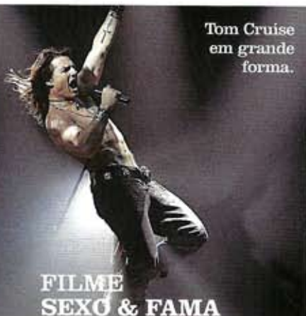
Tom Cruise em grande forma.

FILMES • LIVROS • TELEVISÃO • EXPOSIÇÕES